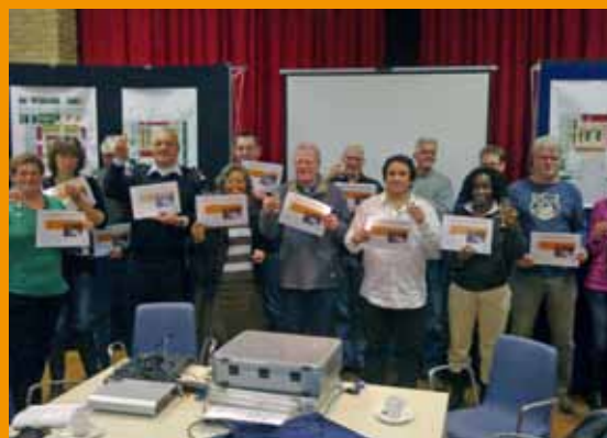
Deelnemers met certificaat

In een (voorlopig) laatste snelkooksessie eind januari hebben we onder andere met elkaar geëvalueerd. Conclusie is dat we deze manier van werken moeten vasthouden, ook in de komende jaren. Het goede meedenken en meepraten is beloond voor de deelnemers met een certificaat 'cursus stedenbouw'. Alle deelnemers gefeliciteerd en bedankt voor de fijne samenwerking!